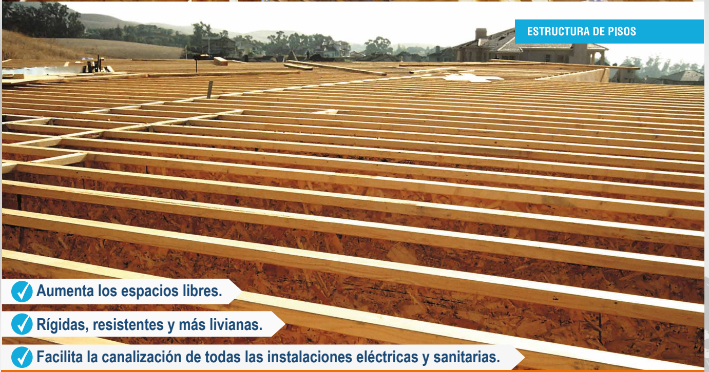
ESTRUCTURA DE PISOS